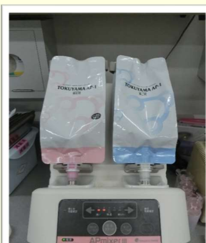
印象材自動練和器