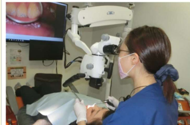
マイクロスコープ4台