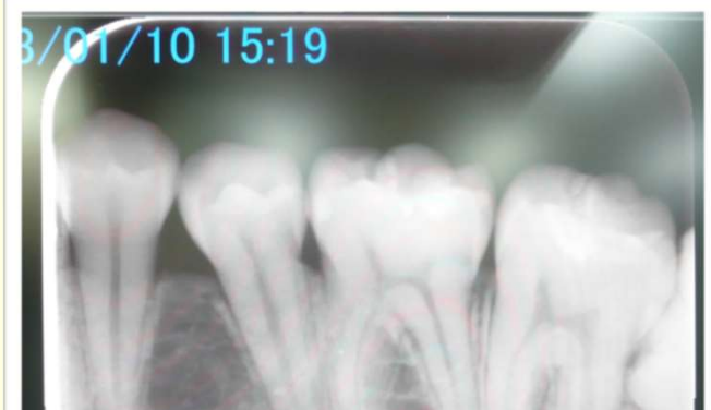
デジタルレントゲン