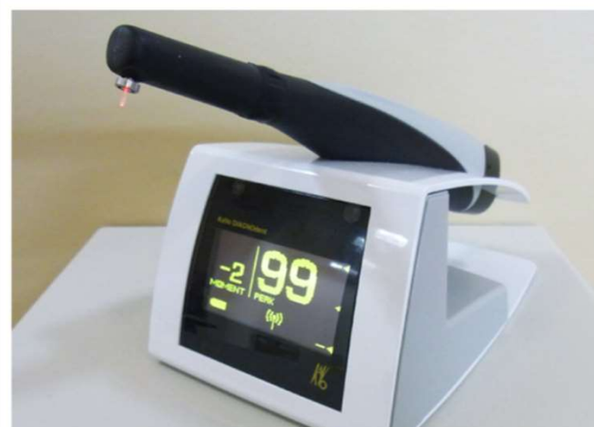
ダイアグノデント